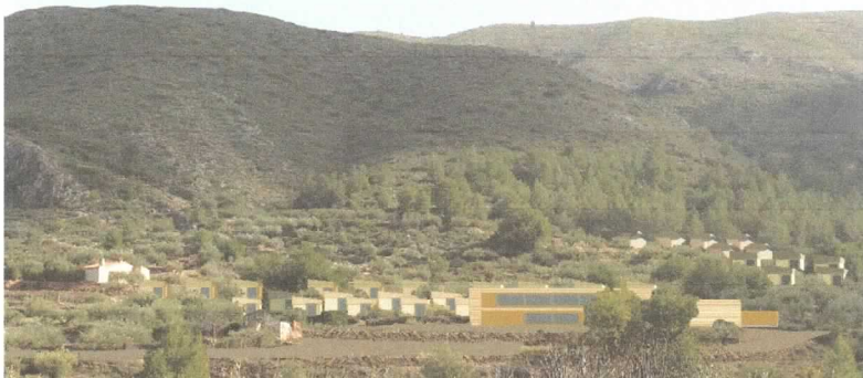
PROPUESTA ORDENACIÓN DE PARCELA